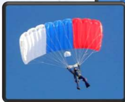
Парашют типа «крыло»