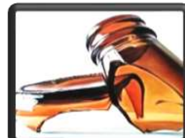
бутылки, осколки стекла