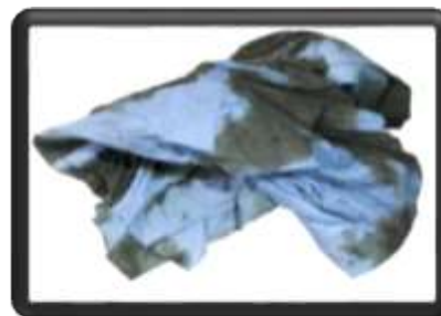
тряпки, пропитанные горючими веществами